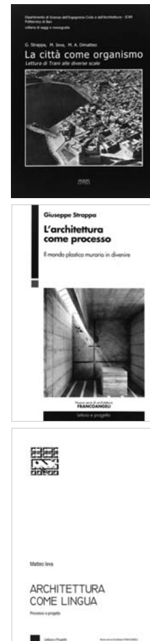
Fig. 2 - "La città come Organismo. Lettura di Trani alle diverse scale" (G. Strappa, M. Ieva, M.A. Dimatteo, 2003); "L'architettura come processo. Il mondo plastico murario in divenire" (G. Strappa, 2014); "Architettura come lingua. Processo e progetto" (M. Ieva, 2018).

"disciplining" the experts of a strict and exclusive practice such as that of design, through a kind of knowledge aimed at learning and demonstrating the vitality of the phenomena that give rise to the architecture of the city and of the territory. Now, this attitude to understand and transmit the constitutive-argumentative dimension of the form actually characterizes a very specific idea of didactics: that of "taught architecture" (architettura insegnata), projected towards the definition of interpretative categories, at the same time general and unifying, aimed at remedying to the vision of apparent indeterminacy of the actual structure of the form itself. These categorial values, although aimed at seeking an orientation, a junction, an intersection of the so-called main directions, are not to be conceived as "facts" crystallized in closed formulas, but rather as "concepts" aimed at ensuring that the architect has an opinion, if not perfect at least organized in intentions, of his "mission".