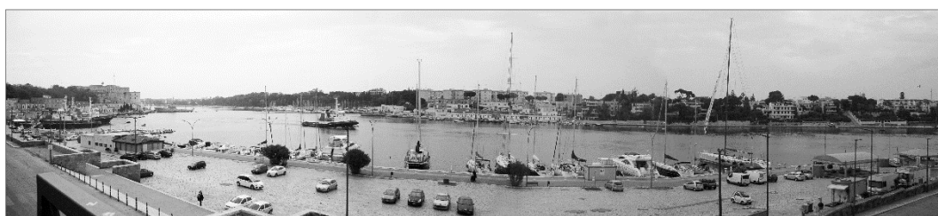
Figura 1. Il porto di Brindisi, Seno di Ponente

Il porto di Brindisi ha origini antichissime, sin dalla dominazione romana, quando divenne uno snodo strategico dell'impero per i traffici verso l'Oriente. Infatti era collocato al termine della via Appia e della via Traiana. Brindisi ha rappresentato un attracco sicuro per secoli, ospitando la Compagnia delle Indie Orientali nel XIX secolo ed, infine, ha avuto un decisivo ruolo militare durante il periodo bellico della prima metà del XX secolo. Il porto di Brindisi, classificato dalla Regione Puglia di I livello, è collocato sulla costa sud-adriatica della Puglia, in una posizione strategica della penisola italiana. E' un porto con funzione passeggeri, commerciale, industriale, militare e turistico, organizzate in tre bacini (Fig.2): porto interno, medio ed esterno.